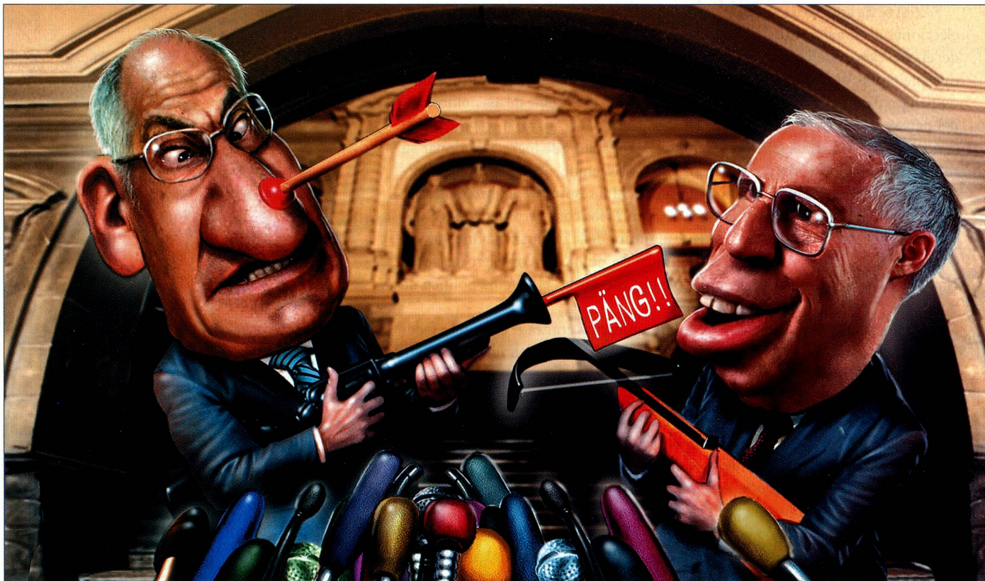
Ilustración: Igor Kravarik

Suiza está orgullosa de su democracia directa. No obstante, hay acaloradas discusiones sobre la función del pueblo y la «incapacidad de reformas» en la Suiza democrática y federal.