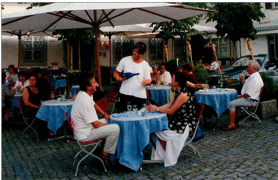
Demanda por buena cocina y servicio perfecto. Aquí, en el restaurante «Linde» de Stans (NW).

¿Busca ideas para una caminata en la región alta de Berna? ¿Desea recorrer Los Grisones en bicicleta? ¿Quiere vacaciones alpinas estivales o esquí en invierno? ¿Disfrutar el wellness, visitar un festival o un museo, recorrer una ciudad? ¿Prevé un fin de semana largo o ya está pensando en sus próximas vacaciones en la patria? Encontrará las respuestas en el sitio de Internet www.MySwitzerland.com de Turismo Suizo. El fácil y sencillo sistema le guía confortablemente a través de las informaciones y ofertas turísticas actuales y hasta incluye la contratación directa de un hotel, casa o apartamento. Desde cualquier lugar del extranjero. RR