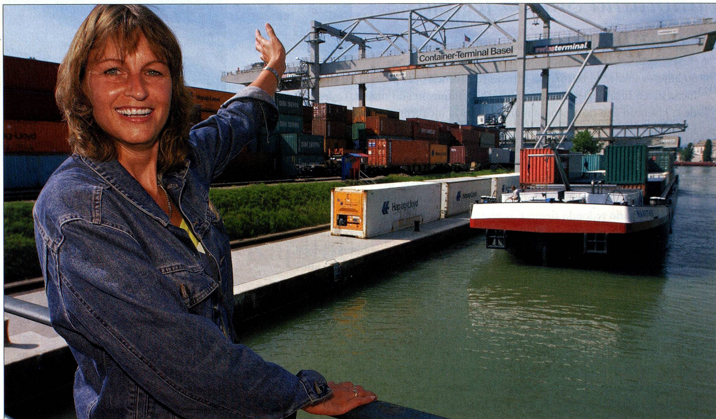
Cuando el contenedor con sus enseres abandona el puerto del Rin en Basilea, el emigrante también da un audaz paso hacia la lejanía.