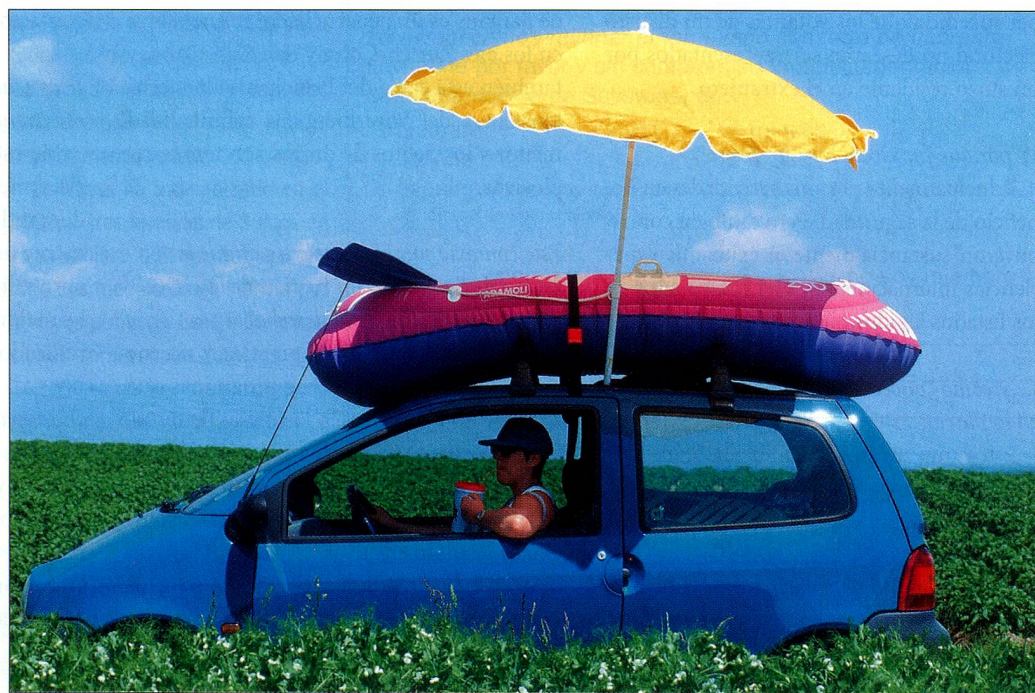
Actualmente informarse sobre la seguridad del destino de las vacaciones es tan importante como cargar correctamente el automóvil antes de partir.