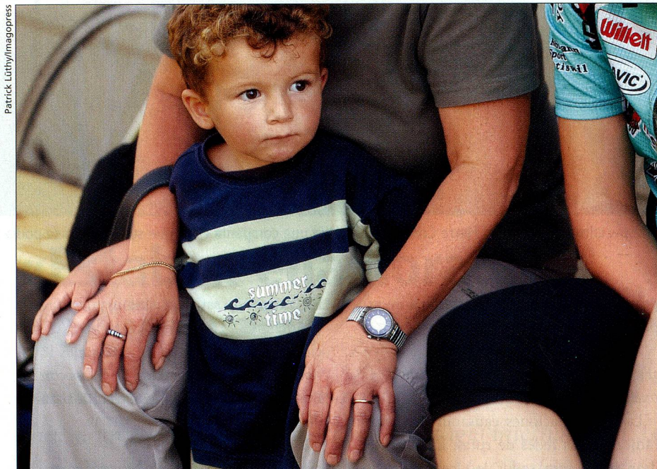
Las familias se aliviarían gracias a mayores descuentos por hijos.

El paquete impositivo fue decidido por el Consejo Federal en el 2001. Contiene tres