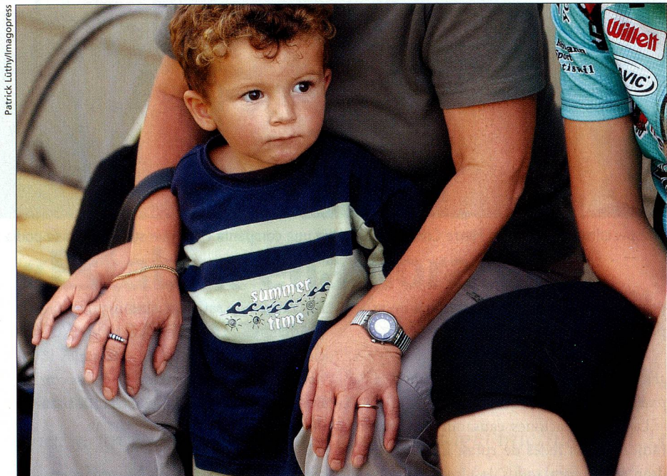
Las familias se aliviarían gracias a mayores descuentos por hijos.

El paquete impositivo fue decidido por el Consejo Federal en el 2001. Contiene tres