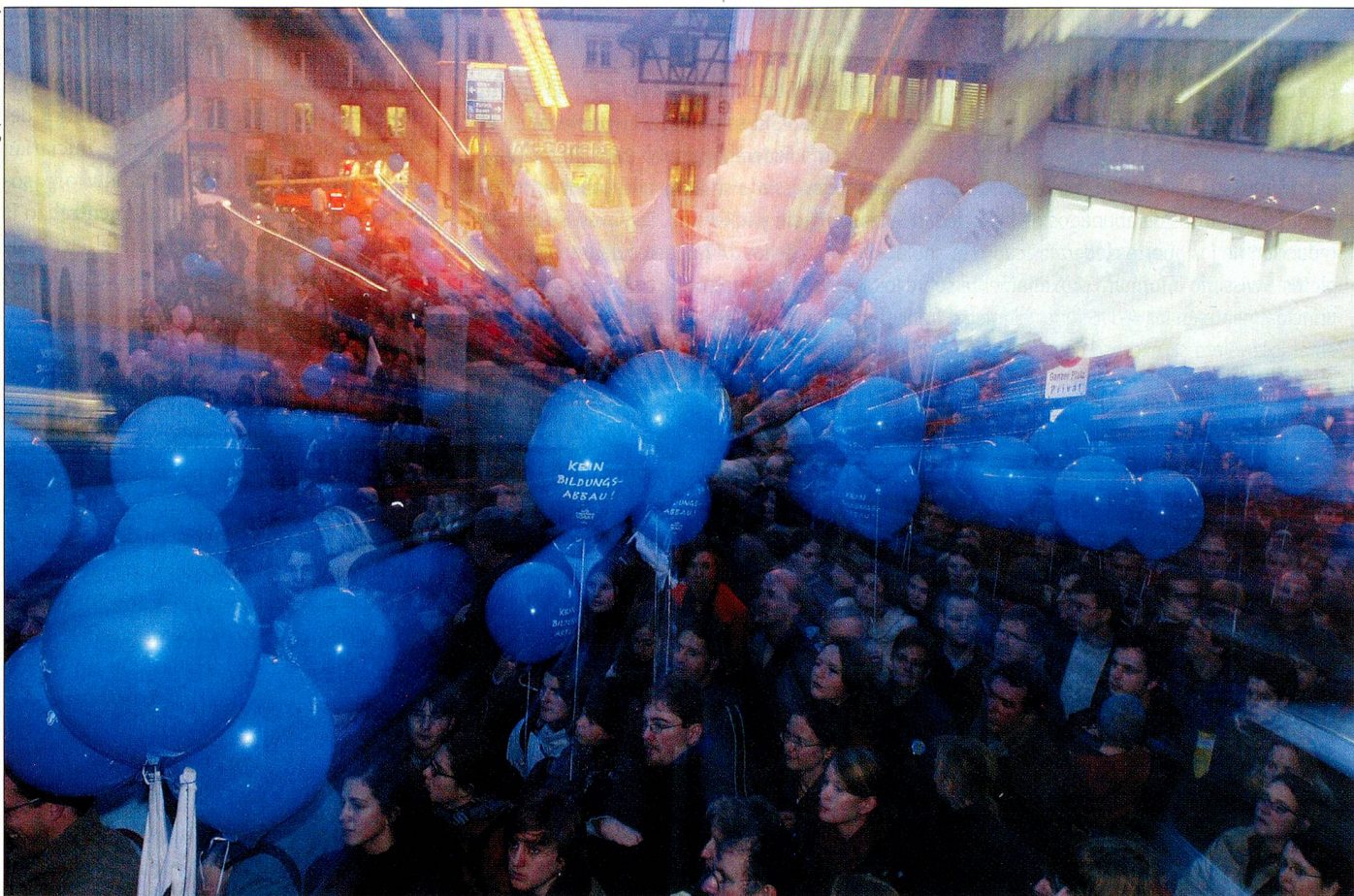
El sector rojo-verde se resistió al programa de descarga. En la foto, una demostración en Argovia contra los planes de ahorro.