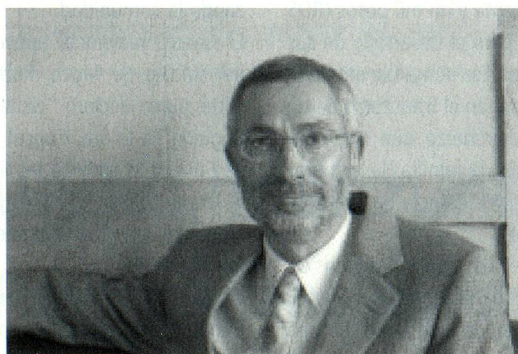
Embajador de Suiza en el Perú, Sr. Beat Loeliger

El 22 de abril de 2004 se realizó el "Reencuentro de los Suizos de la Tercera Edad" en la residencia del Embajador de Suiza en el Perú, Sr. Beat Loeliger. El evento fue