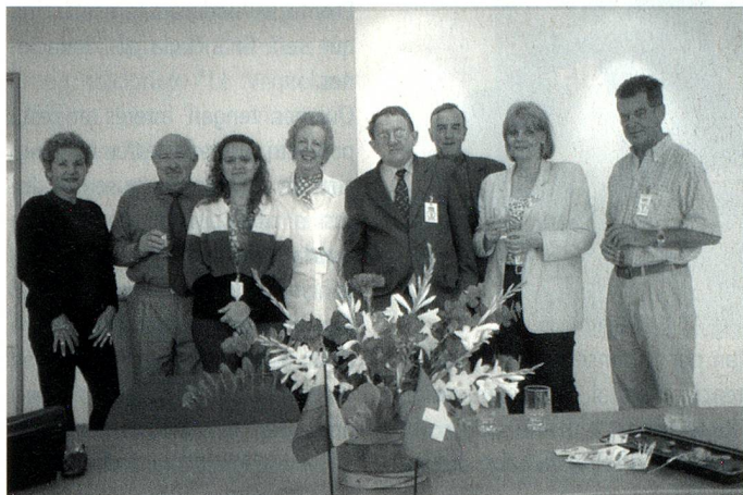
Firma del Acta Constitutiva de la Fundación Espacio Suizo (12 de febrero de 2004)

Luego del éxito alcanzado con el ambicioso proyecto Impacto Suizo realizado en marzo de 2002 entre la Embajada de Suiza en Venezuela y la Cámara Venezolano-Suiza de Comercio e Industria, en las ciudades de Caracas y Maracaibo, con eventos en el ámbito económico-comercial, académico, cultural y gastronómico, surgió la idea de mantener en Venezuela la imagen de Suiza como país multicultural y polifacético con grandes aportes en las áreas antes mencionadas.