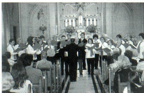
Concierto en "Nuestra Sra. de la Misericordia" de Flores.