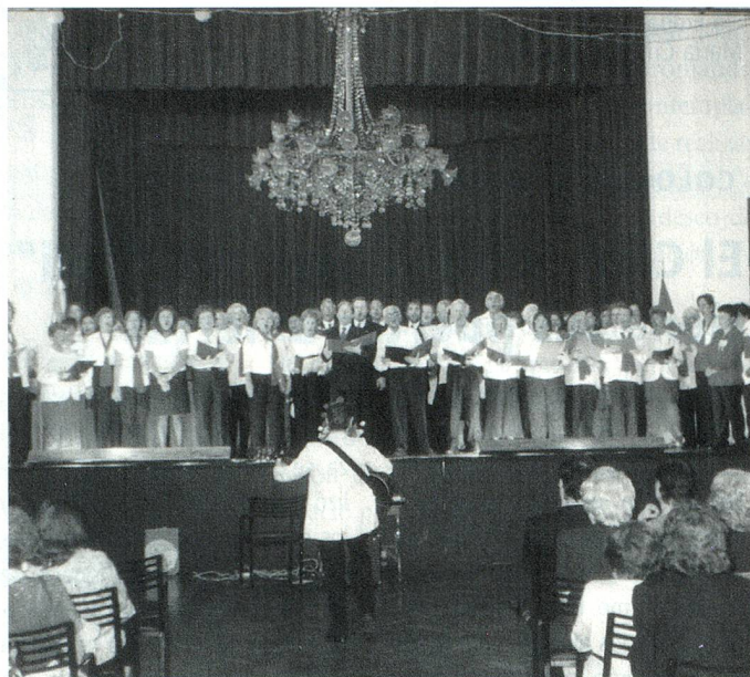
Cierre del I Encuentro Coral organizado por el Coro Suizo de Bs.As.