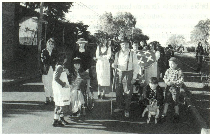
Presentación de Heidi, sus amigos y el abuelo en la Fiesta del Inmigrante

Para festejar el primer año de su nueva sede, la Asociación ofreció en el Salón Imperial, una cena show en la que participaron socios y allegados a esa centenaria institución esperancina. ■