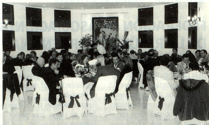
Salón Imperial de la Asociación Suiza "Guillermo Tell" de Esperanza

(7 al 15 de setiembre) Desde el año 1980, en el Parque de las Na-