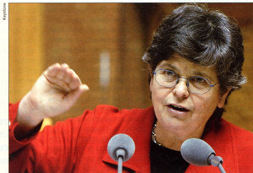
La consejera federal Ruth Dreifuss habló el 16 de abril en la sesión especial del Consejo Nacional refiriéndose a la revisión de la LPL.

Según la revisión de la Ley de Previsión Laboral (LPL), los que tan sólo ganan CHF 1.500 mensuales también tienen que poder beneficiarse con el 2º pilar de previsión laboral. El Consejo Nacional decidió esto en abril, en el marco de una sesión especial de tres días.