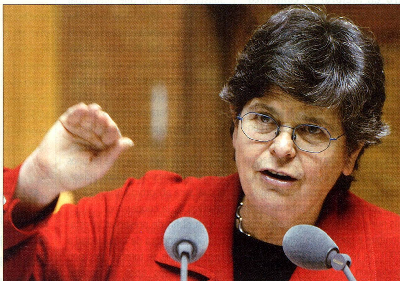
La consejera federal Ruth Dreifuss habló el 16 de abril en la sesión especial del Consejo Nacional refiriéndose a la revisión de la LPL.

Según la revisión de la Ley de Previsión Laboral (LPL), los que tan sólo ganan CHF 1.500 mensuales también tienen que poder beneficiarse con el 2º pilar de previsión laboral. El Consejo Nacional decidió esto en abril, en el marco de una sesión especial de tres días.