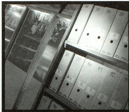
De la exposición referente al informe final de la Comisión Independiente de Expertos Suiza – 2º Guerra Mundial en el Foro Político Käfigturm de Berna.

inmediatamente y sin burocracia, las medidas necesarias. Esto no sucedió por codicia, sino por falta de sensibilidad hacia un problema considerado marginal o por el empeño de poder seguir aprovechando las ventajas de la estrategia de discreción (secreto