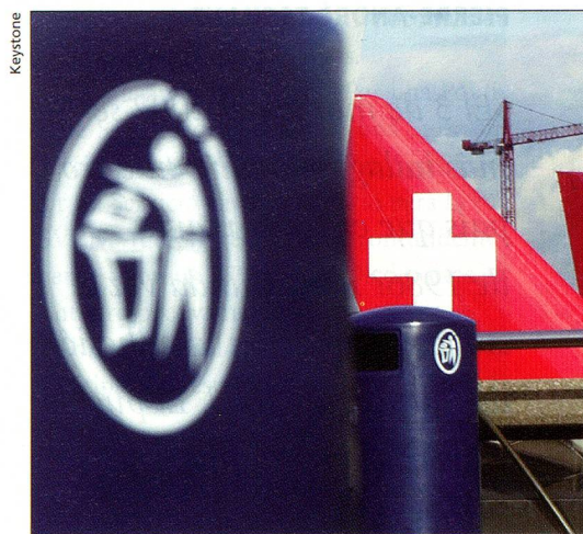
La debacle de Swissair sacudió la percepción propia de Suiza

La nueva ley sobre el seguro de enfermedad, lanzada en 1994, no logró cumplir con uno de los puntos prometidos originalmente: restringir los costos de la salud pública. Durante los últimos años las primas de los seguros de enfermedad aumentaron incesantemente. En el marco de la revisión presentada al Consejo de los Estados, los «senadores» han propuesto determinadas correcciones, tales como suprimir para las cajas de enfermedad la obligación de reconocer a todos los prestadores de servicios médicos. Esto podría significar para los pacientes una limitación de la libre selección de médicos y farmacias. Los consejeros de los estados aprobaron también la ley de equiparación de los discapacitados: dentro