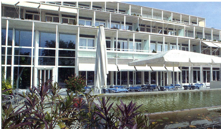
Variante de lujo para altas exigencias: el Parque Residencial de Meilen.