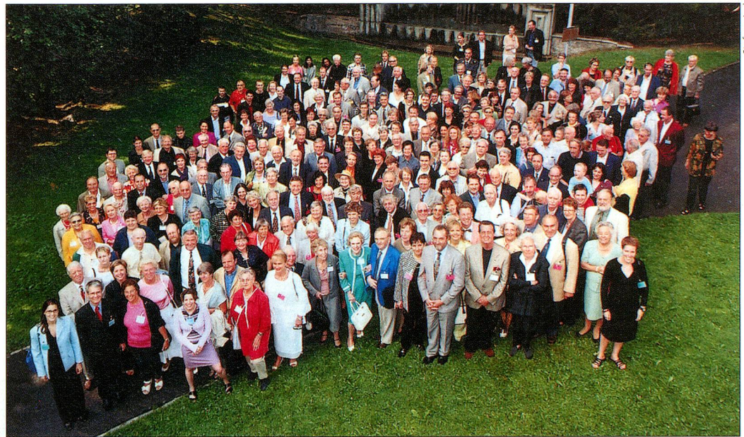
Radiantes miembros del CSE frente al Centro de Congresos de Davos.