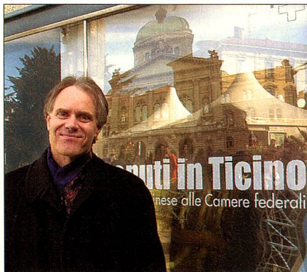
Leuenberger, presidente, federal, en Lugano.

Después de la sesión realizada en Ginebra en el año de 1993, los miembros de los Consejos Federales celebraron una «sesión fuera de casa» en Lugano del 5 al 23 de marzo.