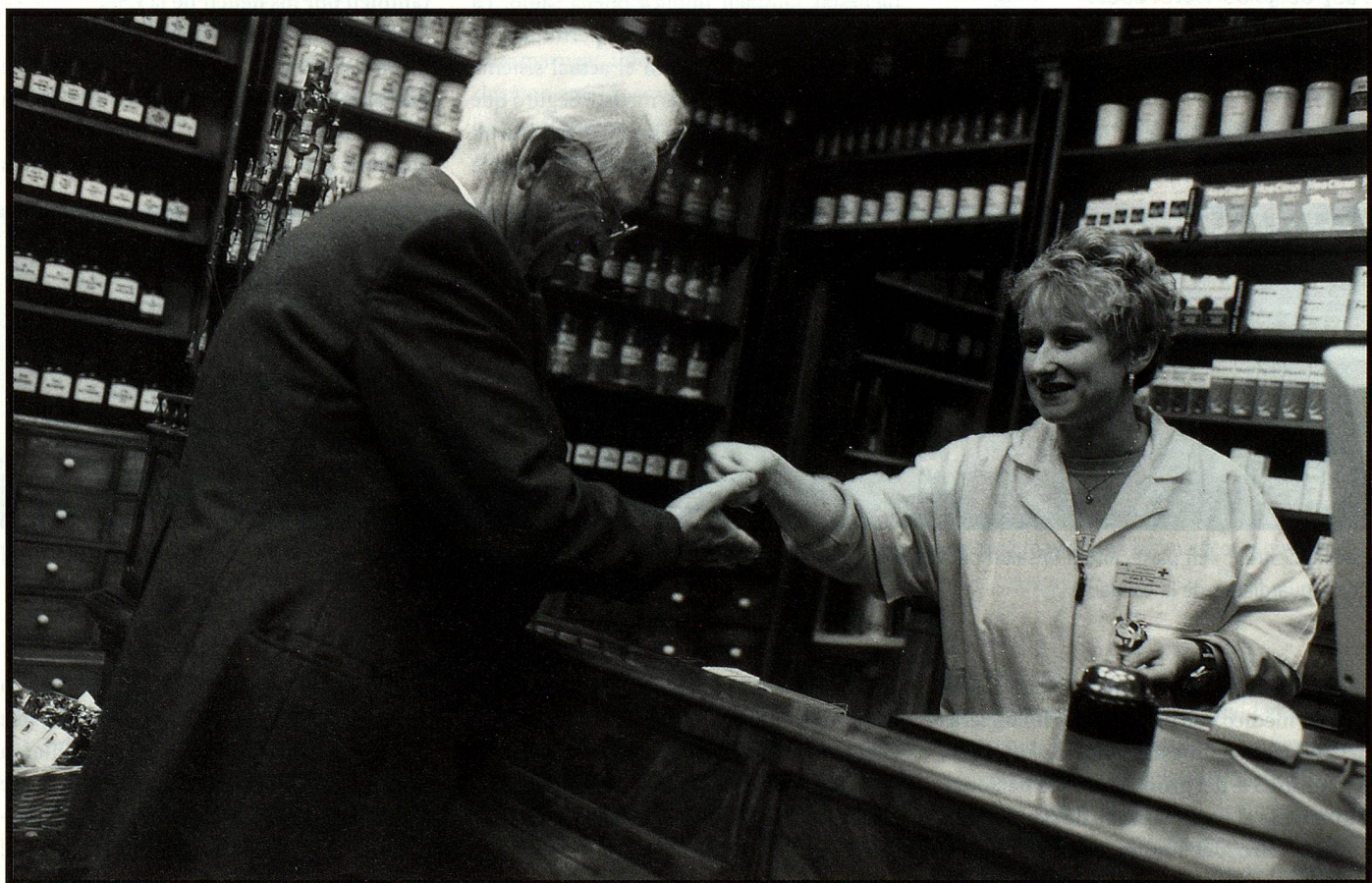
A partir de mediados del año, los apotecarios también cobran por sus servicios de asesoramiento.