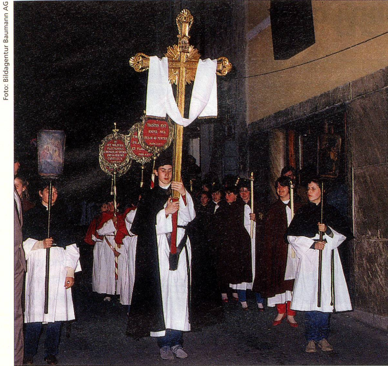
La procesión del Viernes Santo en Mendrisio es un ritual religioso muy impresionante.

Luego la fiesta sigue en los patios de las casas.