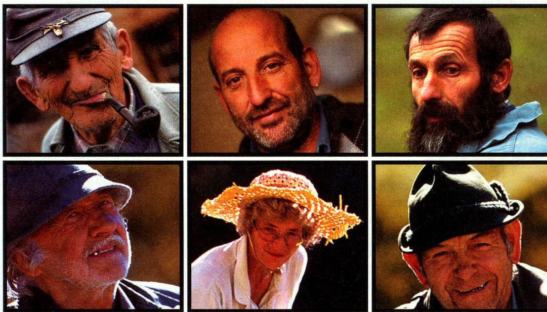
La gente parece tallada de madera.

La disolución de los monopolios estatales de los servicios públicos dificulta la situación de las regiones remotas. En nuestras diferentes regiones idiomáticas hay preocupación y apuros pero también surgen medidas innovadoras contra la amenaza de suspender la cobertura completa de los servicios básicos.