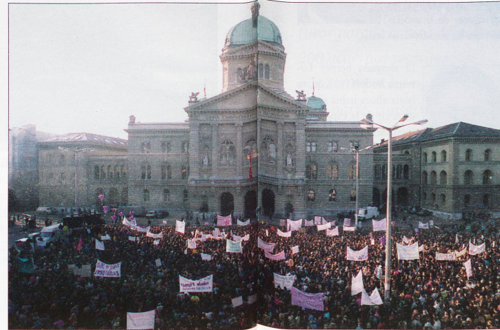
En 1993, la no elección de Christiane Brunner fue una desilusión enorme para el movimiento femenino.

La iniciativa popular «Por una Democracia Directa más Rápida» pretende obligar a