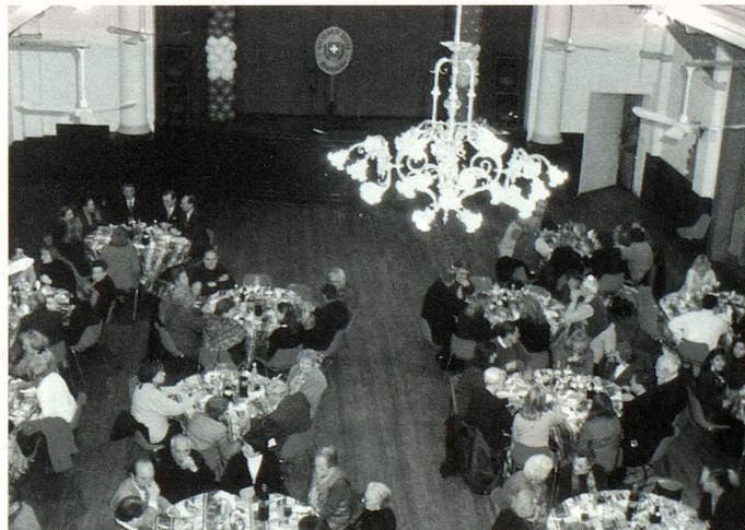
Vista del salón de la Sociedad Suiza de Baradero durante el almuerzo

CH-3000 Bern, 16 - Tel.: (0041) 31 351 61 00 - Fax: (0041) 31 351 61 50 e-mail: youth@aso.ch - Internet: http://www.aso.ch (información detallada sobre los módulos)