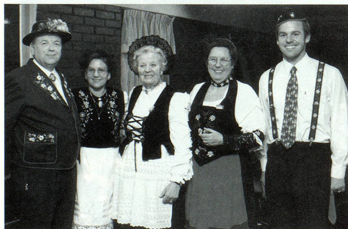
Grupo de asistentes con trajes de diferentes cantones

Con especial entusiasmo y alegría, el día 4 de Agosto se dieron cita en el Club Alemán de Temuco, suizos, descendientes y amigos para celebrar el 709° Aniversario de la querida patria Suiza.