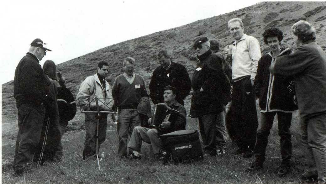
Integrantes de Zillertal, junto a turistas argentinos y anfitriones de Suiza en Grengiols.

El programa incluyó una participación especial en el pueblo valesano de Grengiols, en el que se llevó a cabo una celebración con motivo de los 200 años de la reconstrucción de la localidad. La