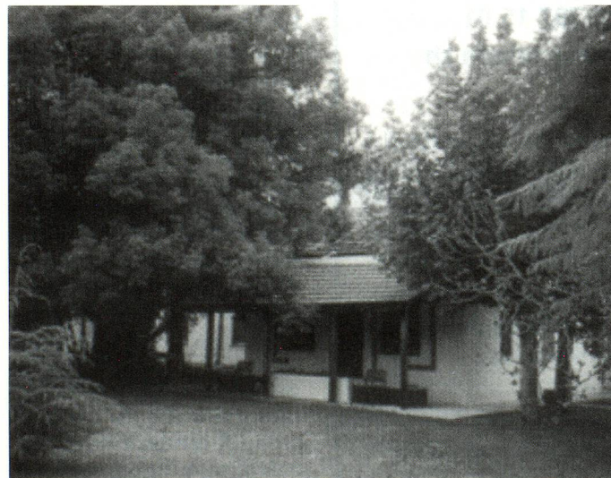
Vista posterior del hogar, ubicado en la localidad de Villa Ballester

La dirección del Hogar Suizo para Ancianos es Calle Mónaco 750 (1653) Villa Ballester, Tel. 4720-2159 / 1267 y 4371-0467, Fax: 4720-8853