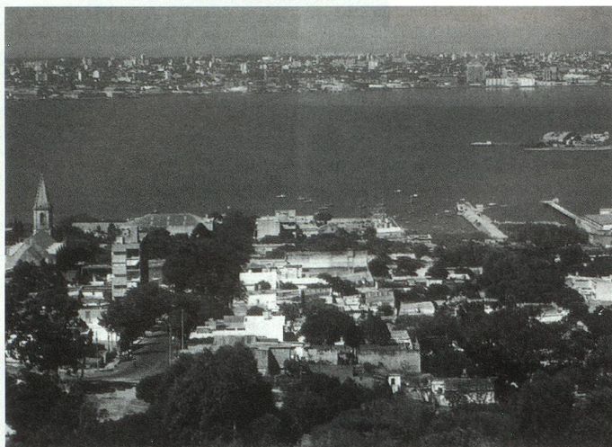
Montevideo, Uruguay. Vista parcial de la ciudad y sus costas

El primer Club Suizo de Montevideo fue fundado el 24 de mayo de 1868 y funcionó hasta fines de 1880. Volvió a operar como tal desde 1894 hasta fines de ese siglo. En ambos casos, su cese de actividades se debió posiblemente al traslado de socios al interior del país y a las dificultades por las que pasaba el Uruguay durante esos años. Coincidiendo con la festividad patria, el 1° de agosto de 1918 se funda el actual "Club Suizo de Montevideo" pudiendo decir con orgullo que entramos en el siglo XXI con más de 81 años de vida ininterrumpida.