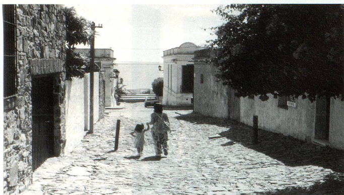
Ciudad de Colonia, Uruguay. Vista de una de las calles que desemboca en las costas de la ciudad.

La ciudad uruguaya de Nueva Helvecia, situada en el departamento rural de Colonia, fue fundada por inmigrantes en su mayoría suizos cuyo primer contingente llegó el 21 de noviembre de 1861. Estos pioneros se instalaron sobre tierras adquiridas previamente en 1858 por el bernés Carlos Cunier y, en el transcurso de los años, fueron seguidos por otros helvecios en busca de una nueva vida en el Uruguay dando así nacimiento a una ciudad próspera, Nueva Helvecia, que cuenta actualmente con 7500 habitantes.