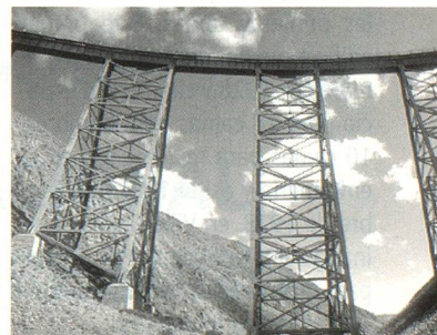
Vista panorámica de un trayecto del Tren a las Nubes, Salta

El propósito de esta nueva agrupación suiza es el de crear un espacio suizo para Salta propendiendo a la difusión de la vida y la cultura helvéticas con una perspectiva de apertura e integración. A tal fin se ha formado una Comisión Directiva integrada de la siguiente manera: