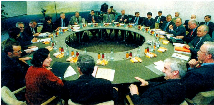
Die Gespräche am Runden Tisch haben zur langfristigen Sanierung der Bundesfinanzen beigetragen.