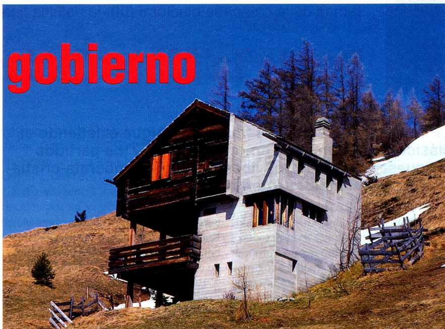
El SI a la revisión de la ley sobre el urbanismo facilita el empleo de edificios de granjas existentes para usos nuevos.