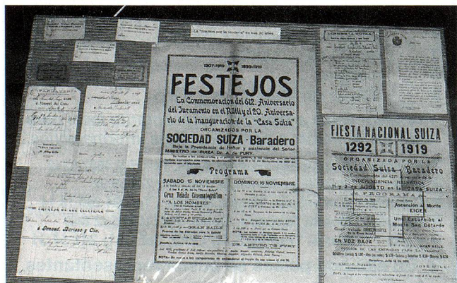
Detalle de la Exposición de los Archivos de la Sociedad Suiza de Baradero

Esta Exposición, evocativa de la historia de los colonos friburgueses en Baradero tendrá además un aspecto de acercamiento fraterno ya que está previsto el viaje a la Argentina de un grupo de suizos dentro del marco de las conmemoraciones del Centenario de la Casa Suiza de Baradero.