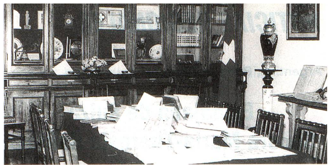
La Biblioteca casi centenaria de la Casa Suiza de Baradero

En otro orden de cosas, continúan las clases de francés, alemán y portugués en las cómodas aulas de la Es-