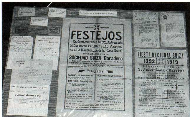
Detalle de la Exposición de los Archivos de la Sociedad Suiza de Baradero

Esta Exposición, evocativa de la historia de los colonos friburgueses en Baradero tendrá además un aspecto de acercamiento fraternal ya que está previsto el viaje a la Argentina de un grupo de suizos dentro del marco de las conmemoraciones del Centenario de la Casa Suiza de Baradero.