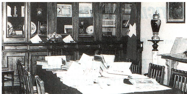
La Biblioteca casi centenaria de la Casa Suiza de Baradero

En otro orden de cosas, continúan las clases de francés, alemán y portugués en las cómodas aulas de la Es-