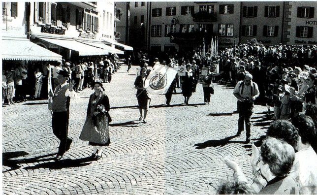
Desfile de E.V.A. por las calles de Brig.

Las asociaciones surgieron, se fueron consolidando y comenzaron a comunicarse entre sí. En ese momento nació Entidades Valesanas Argentinas (E.V.A.) en Esperanza (Santa Fe), el 8 de mayo de 1993, vinculando fraternalmente a los descendientes de valesanos y dando trascendencia nacional a las instituciones locales. Esta dimensión se fue afianzando con proyectos comunes, con apertura hacia Suiza y Brasil, manteniendo vivos los valores, la herencia cultural y las costumbres de los inmigrantes valesanos que, echando raíces en América, nos dieron identidad de argentinos con ascendencia valesana. En la actualidad, EVA está integrada por instituciones de las provincias de Santa Fe,