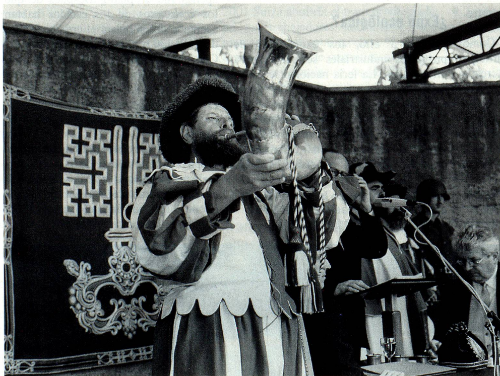
Esta imagen pertenece al pasado. En Nidwalden ya no hay Landsgemeinde.

La participación de votantes más bien baja del 47% demuestra que el debate sobre la abolición de la Landsgemeinde ni siquiera causó furor en Nidwalden. Actualmente aun existe la Landsgemeinde en los siguientes cantones: los 2 Appenzell, Glarus y Obwalden. ■