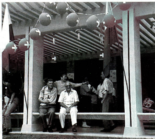
Parte de la concurrencia en Medellín.