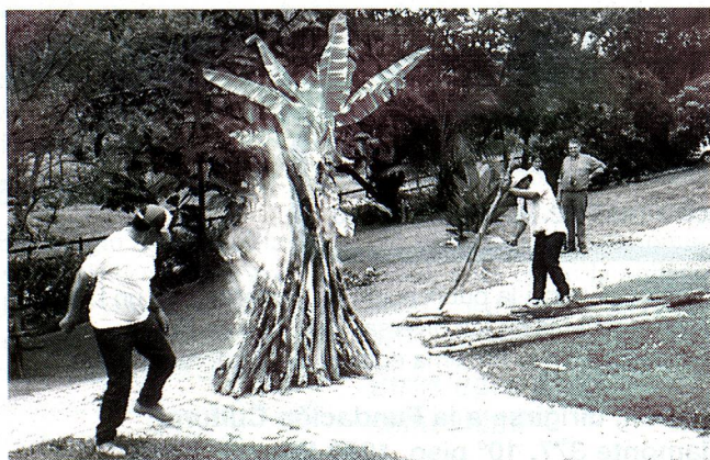
Encendiendo la fogata.

La colonia suiza de Medellín celebró así con gran éxito el Día Nacional Suizo.