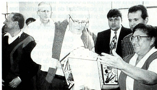
El Ministro de Relaciones Exteriores de Suiza señor Flavio Cotti visitando las instalaciones de la panadería "El Buen Pastor", uno de los proyectos financiados por el Fondo de Contravalor Perú-Suiza

En Ventanilla, Dentro del marco de las actividades llevadas a cabo por el Fondo de Contravalor Perú-Suiza