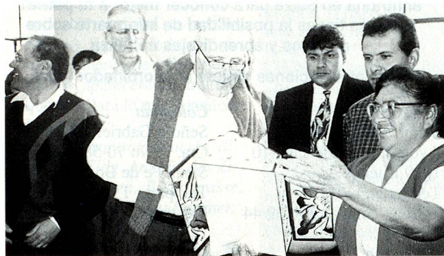
El Ministro de Relaciones Exteriores de Suiza señor Flavio Cotti visitando las instalaciones de la panadería "El Buen Pastor", uno de los proyectos financiados por el Fondo de Contravalor Perú-Suiza

En Ventanilla, Dentro del marco de las actividades llevadas a cabo por el Fondo de Contravalor Perú-Suiza