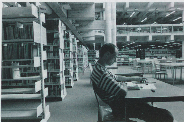
En 1997: primeras escuelas técnicas superiores