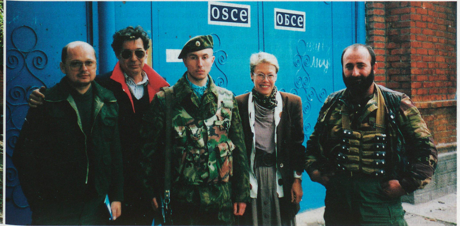
Heidi Tagliavini ante el portal de la Misión de la OSCE, junto con sus colegas de Polonia y Hungría, un oficial ruso (centro) y un guardaespaldas checheno.

Impresiones personales del comienzo de la misión de la OSCE en Chechenia