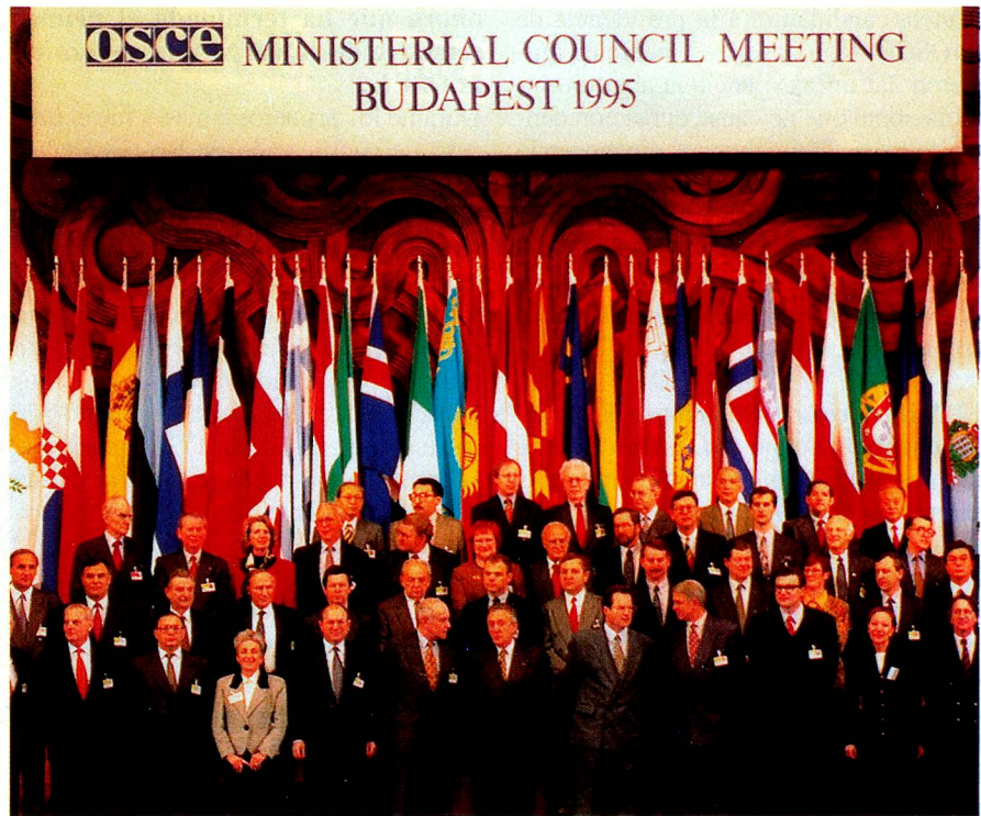
En la conferencia de ministros de la OSCE llevada a cabo en Budapest, Hungría, el pasado diciembre, se inició la presidencia de Suiza.

La responsabilidad general por la implementación de los objetivos de la OSCE (dirección de las operaciones de diplomacia preventiva, tomar la iniciativa en casos de crisis y/o cuando se violan las reglas de la OSCE y el presidio de los diferentes órganos) este año le corresponde a Suiza con el apoyo de Hungría y Dinamarca. La realización