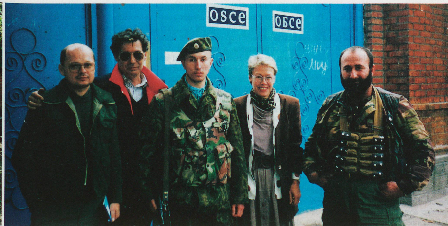
Heidi Tagliavini ante el portal de la Misión de la OSCE, junto con sus colegas de Polonia y Hungría, un oficial ruso (centro) y un guardaespaldas chechenio.

Impresiones personales del comienzo de la misión de la OSCE en Chechenia