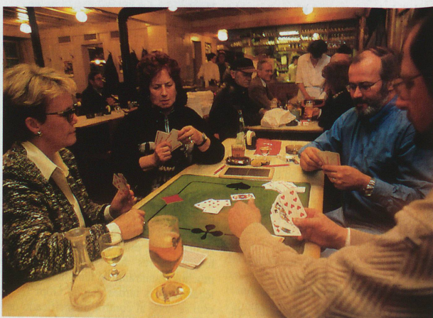
Los jugadores de Jass «interculturales»: una velada amena con profundos conocimientos sobre la convivencia amigable en Suiza.

sobre las reglas antes de empezar. Mientras que la rueda semanal de Jass en el restaurante del pueblo no requiere reglas especiales, al jugar con personas de «otra cultura» esto se vuelve imperativo.