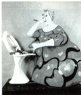
Maquillaje ó El Espejo de la Vida (1978) de Niki de Saint Phalle

En Caracas se acercó a parte del trabajo del arquitecto Carlos Raúl Villanueva, la Universidad Central de Venezuela, la Galería Nacional y el Museo de Bellas Artes. Su ar-