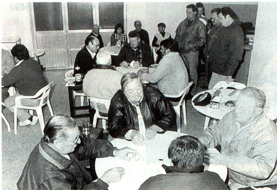
Un momento del certamen

Dentro del marco de la 6ª Fiesta Nacional del Folclore suizo, acontecimiento que anualmente revive la cultura, la música, el idioma y las costumbres que trajeron nuestros antepasados de Suiza, tuvo lugar un interesante Concurso de Jass, realizado el viernes 31 de mayo con singular éxito.