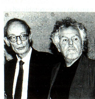
Los tres arquitectos que asistieron a la Exposición.

Botta puso énfasis en el estudio del arquitecto de su medio ambiente, luz, clima y paisajística y que solo después de estudiado esto se diseña y se seleccionan los materiales.