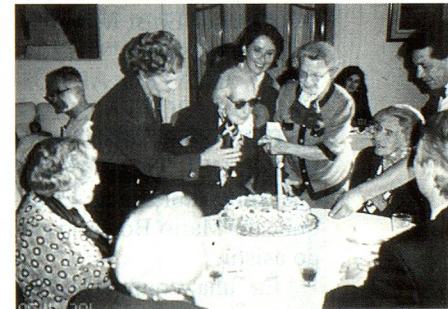
La homenajeadada soplando el velón de su centenario, rodeada de compatriotas y amigos.