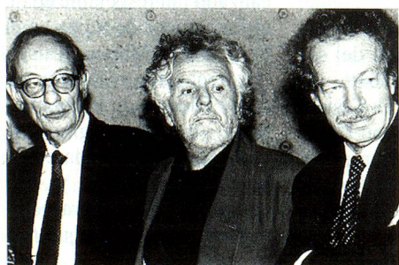
Los tres arquitectos que asistieron a la Exposición.