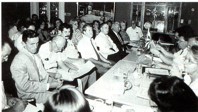
La mesa directiva compuesta de autoridades suizas de Berna y de Buenos Aires y una parte de los asistentes. (foto gentileza del señor Stern).

El Sábado 9 de marzo de 1996, en las instalaciones del Tigre del Club Suizo de Buenos Aires tuvo lugar una inolvidable jornada de la que participaron los presidentes y principales miembros de todas las asociaciones suizas de la Argentina, a la que se sumaron los presidentes de clubes suizos de Chile, Uruguay, el encargado de Negocios de Paraguay y un representante de Radio Suiza internacional.