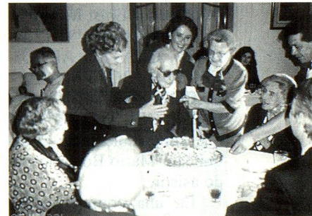
La homenajeadada soplando el velón de su centenario, rodeada de compatriotas y amigos.