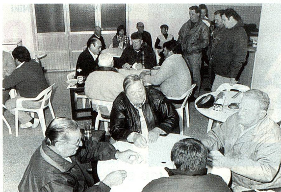
Un momento del certamen

Dentro del marco de la 6ª Fiesta Nacional del Folclore suizo, acontecimiento que anualmente revive la cultura, la música, el idioma y las costumbres que trajeron nuestros antepasados de Suiza, tuvo lugar un interesante Concurso de Jass, realizado el viernes 31 de mayo con singular éxito.