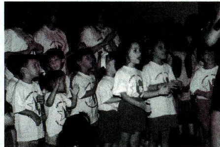
Niños del Jardín de Infantes del Centro de Estudios Valais-Argentina cantan en francés en el acto de inauguración del "Salón de la Amistad". 22-12-95

Además se realizó un viaje a Europa y 25 alumnos del Centro siguieron un curso de perfeccio-