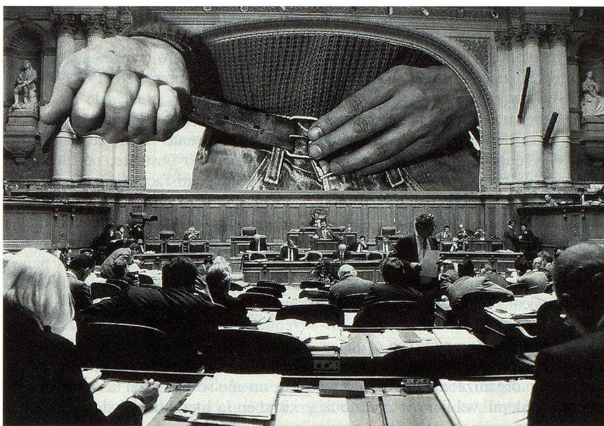
En el año de las elecciones federales, los parlamentarios titubean y no saben quién debe apretarse el cinturón.