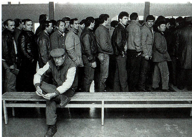
Trabajadores temporeros al pasar la frontera en Buchs, SG: en Suiza siempre hay quien trate de limitar el número de extranjeros.

el Fondo de Solidaridad con gusto asesoraremos a quienes deseen repatriarse antes de que entre en vigor la nueva ley.