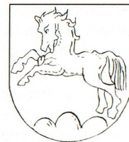
Escudo de la familia Rudolf

Los primeros indicios del asentamiento de los Rudolf en el país evidencian que el 13 de febrero de 1856 parten de Suiza con destino a la Argentina tres herma-