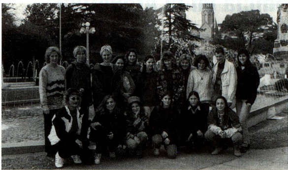
Grupo de jóvenes suizos en Esperanza (Santa Fe)