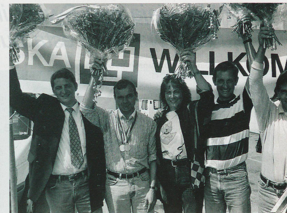
...y los jinetes.

para los deportistas profesionales. Sobre decir, que esto no alcanza para que los atletas puedan ser aún más profesionales. Un análisis ha demostrado que actualmente en Suiza las ventas relacionadas con el deporte ascienden a entre 16 y 18 billones de francos. ¿Ahora hasta está de moda ponerse zapatos tenis para andar en la ciudad! La influencia del deporte en la moda de tiempo libre es enorme; pero también en la hotelería, etc. Me parece justo que el comercio y la industria sigan contribuyendo para que podamos apoyar cada vez mejor al deporte, del que tan ampliamente se sirven para propagar sus servicios y productos.