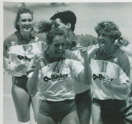
Nos alegraron: las jugadoras suizas de Volleybal...