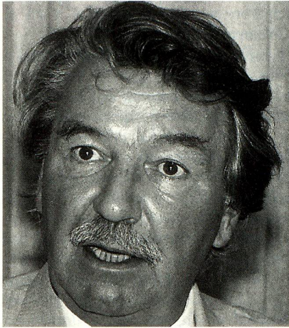
René Felber el consejero federal que renunció a su cargo...