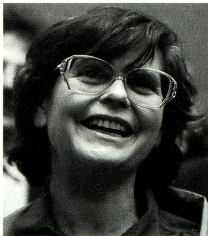
y su sucesora Ruth Dreyfuss.