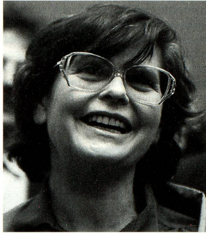
y su sucesora Ruth Dreyfuss.

La 100ª miembro del Consejo Federal y la sucesora de René Felber se llama Ruth Dreifuss. Fue elegida al gobierno nacional después de que Francis Matthey, quien había sido nombrado antes, retirara su candidatura.