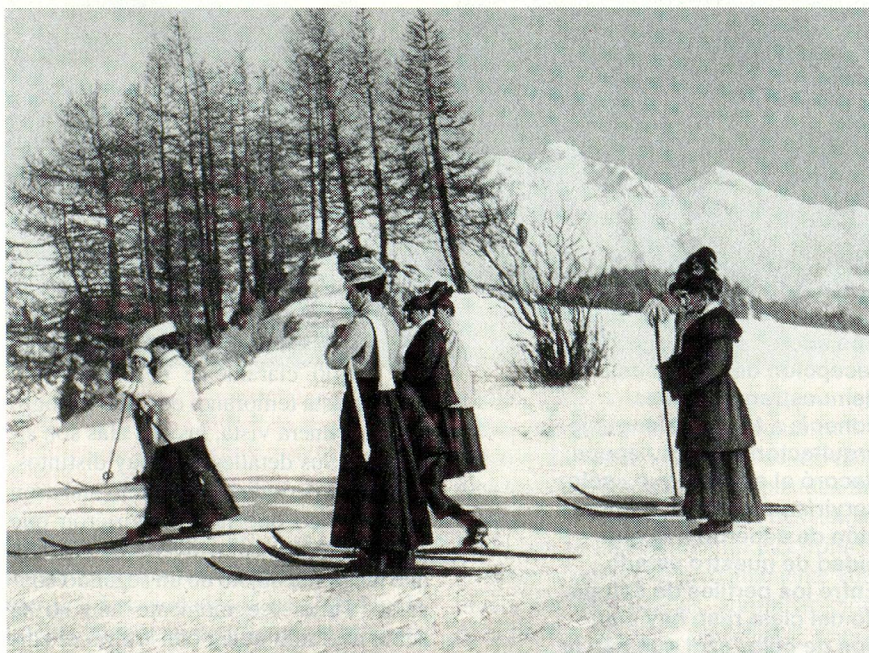
La Central Suiza de Transporte y Comunicación (CSTC) cumplió 75 años: esquiadoras de esa época.

● En una caverna ubicada debajo del Sustenpass, cantón de Berna, en la que la milicia deposita explosivos no reutilizables, estallaron entre 300 y 400 toneladas de explosivos. Las razones aún se desconocen. La caverna quedó enterrada bajo unos 50.000 m³ de roca y escombros. El accidente causó la muerte de seis personas.