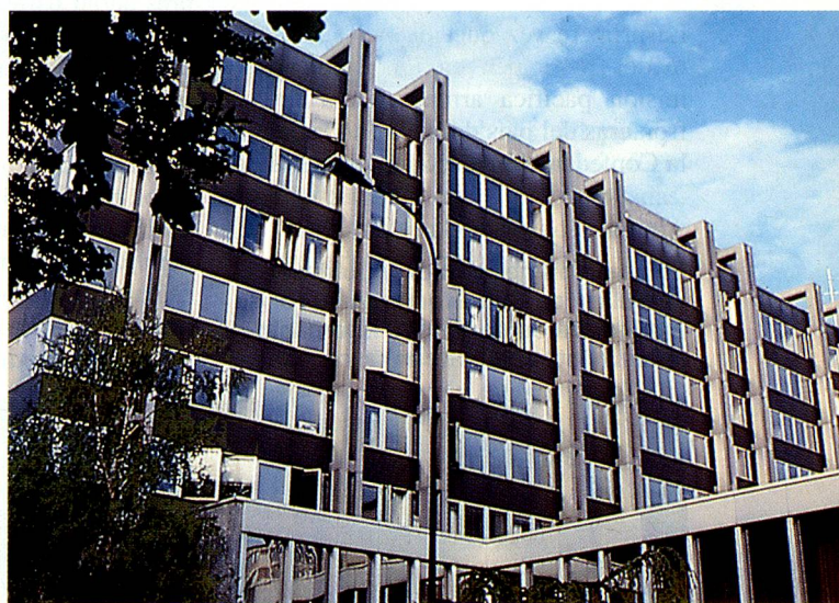
Ginebra es la sede de varias organizaciones internacionales. De izqu. a der.: el edificio de la ONU, de la Organización Mundial de Salud (WHO), Organización Mundial de la Propiedad Intelectual (OMPI) y de la AELC.