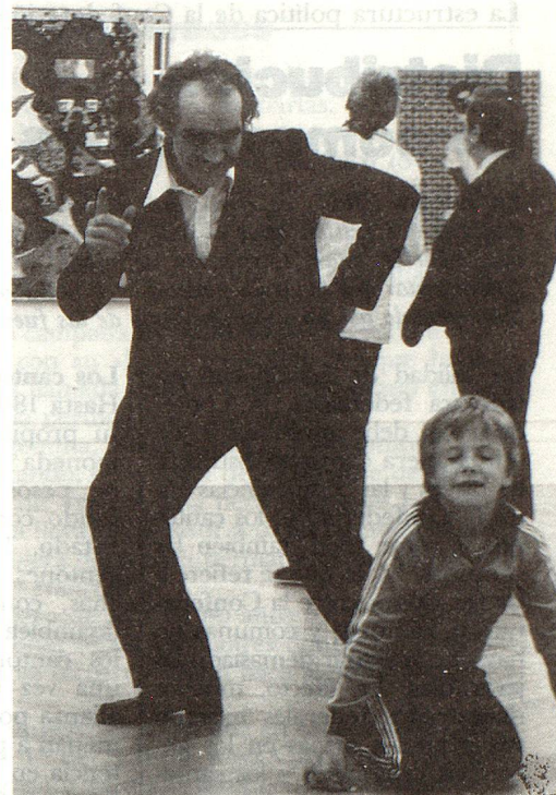
Jean Tinguely. Los niños eran su público preferido.

La fuerza hidráulica, el chico de catorce años la había utilizado primero para mover la rueda provista de dos docenas de martillos o casi, y tal vez hubiera permanecido en la fuerza hidráulica si hubiera podido llevarse consigo sus experiencias cinéticas. Para sus «Moulins à prière» utilizó luego una manivela y a veces un movimiento de relojería y, más tarde, sobre todo el motor eléctrico. Desde 1960, el agua tuvo nuevamente un gran papel en sus fuentes o máquinas de agua, como Tinguely las llamaba, al igual que el fuego, que formaba parte de sus máquinas desencadenando un proceso de autodestrucción. Logró mismo hacer coexistir ambos elementos contrarios en fuegos artificiales submarinos en el mar de Estocolmo. Con