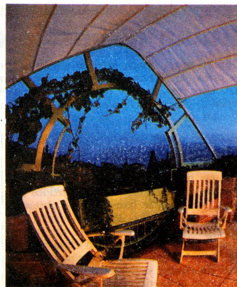
Vista sobre el lago Lemano y los Alpes.

Concebidos en forma de duplex y triplex al igual que en la ciudad, con grandes ventanales abiertos sobre la naturaleza, este tipo de vivienda ofrece muchas posibilidades para una decoración interior tanto fantástica como clásica.