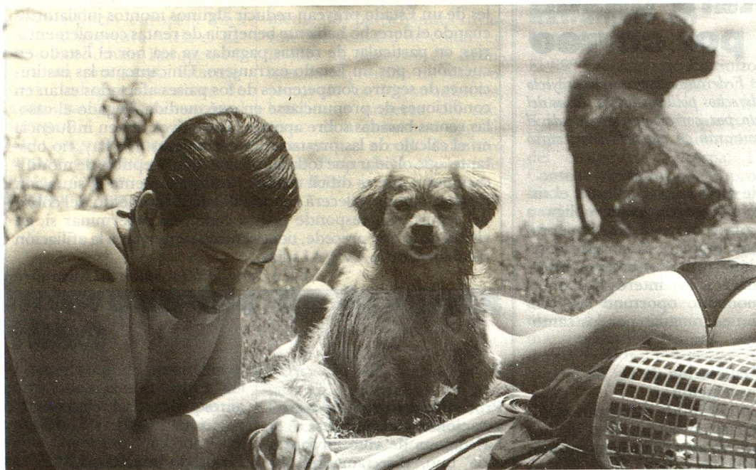
Todo el mundo lee con gusto «Panorama Suizo»...

Mientras que la sección mundial (páginas blancas) de la Revista Suiza tiene para todas partes el mismo contenido, las páginas regionales (verdes) son distintas según los países. En el siguiente cuadro puede verse qué países o continentes tienen sus propias páginas regionales y en qué idioma. Italia, el Liechtenstein y los Estados Unidos tienen no solamente sus propias informaciones locales sino también su propia revista: (1) «Gazetta Svizzera», (2) «Schweizer Bulletin» y (6) «Swiss American Review».