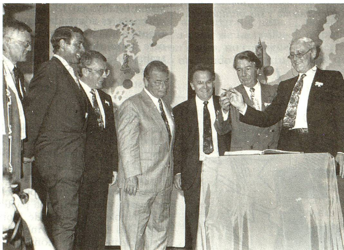
Todos los Consejeros Federales inscriben su nombre en el libro de visitantes.

Europa. Teniendo en cuenta las decisiones históricas que los suizos deberán tomar, instó a los suizos del extranjero a que hicieran uso sistemático de su nuevo derecho de voto por correspondencia y a dar el ejemplo a los ciudadanos residentes en el país con una gran participación.