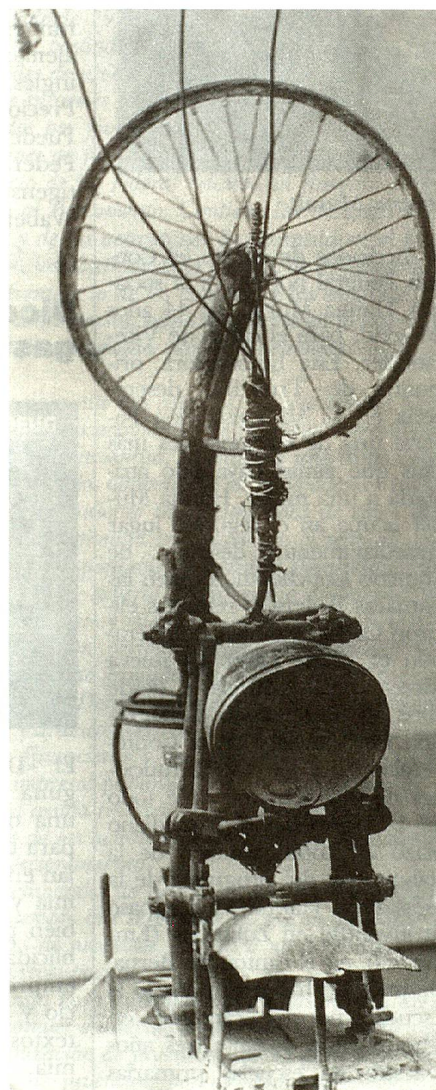
Jean Tinguely, «Homenaje a Duchamp», 1965

El 29 de agosto, a la edad de 66 años, se extinguió en Berna a consecuencia de un ataque, el artista friburgués mundialmente conocido, Jean Tinguely. Con sus cuadros y obras móviles, y ante todo con sus máquinas girando en el vacío, construidas a partir de chata-