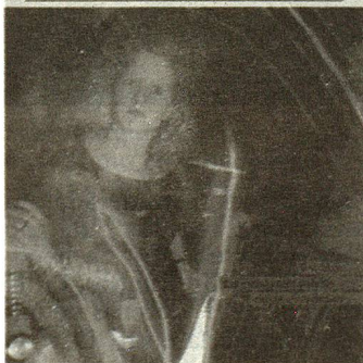
La discoteca a menudo desacreditada pero ampliamente frecuentada: la distracción por excelencia de los jóvenes de 14 a 20 años.