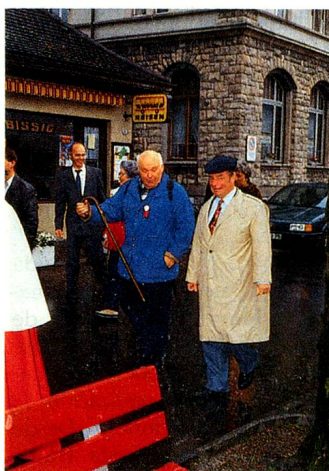
Señor Ulrich Bremi, presidente del Consejo Nacional (izquierda) y Señor Jean-Pascal Delamuraz (derecha), en Brunnen.

Ante la sorpresa de los huéspedes presentes, a los que se agregaron algunos habitantes de Brunnen, invitados espon-