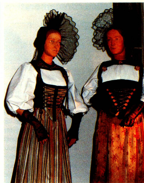
Unas cien figuras, algunas en tamaño natural, fueron confeccionadas para la Exposición Nacional de 1939.

Diversos instrumentos «más callados» nos recuerdan la música doméstica, como por ejemplo la cítara de Schwyz y de Glarus, la cítara de cuello del Emmental, Toggenburgo y